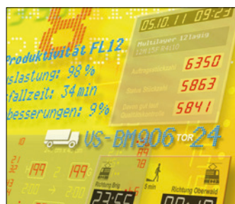
Anzeige- & Informationstechnik