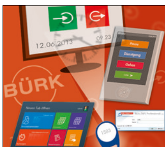
Zeiterfassung & Zutrittskontrolle