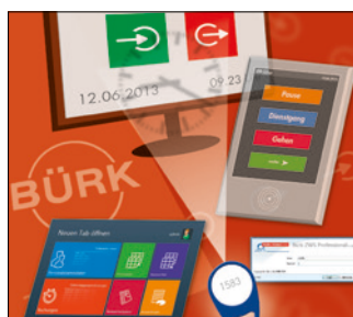
Zeiterfassung & Zutrittskontrolle