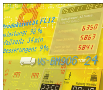
Anzeige- & Informationstechnik