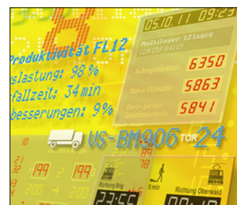
Anzeige- & Informationstechnik