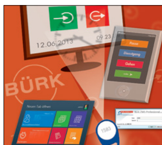
Zeiterfassung & Zutrittskontrolle